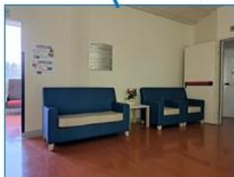
Salottino vano scale