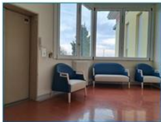
Salottino vano ascensore