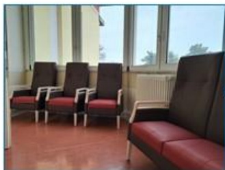
Salottino vano ascensore