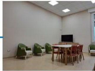
Salottino nucleo tortora