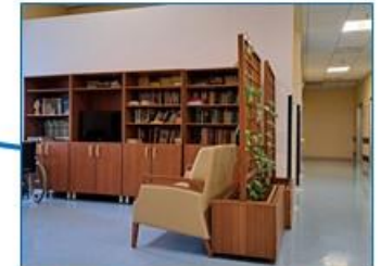
Salottino nucleo giallo